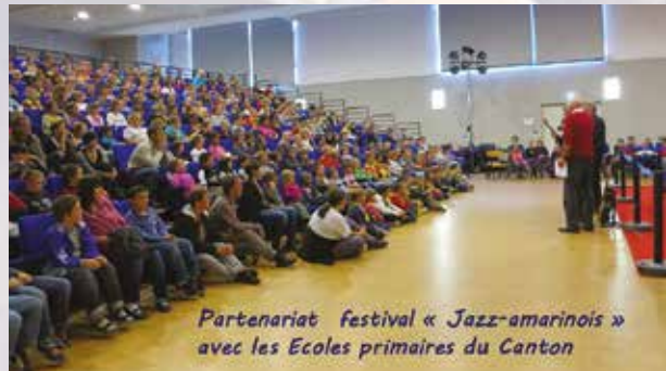
Partenariat festival « Jazz-amarinois » avec les Ecoles primaires du Canton

Plus de 700 élèves ont pu suivre ces séances dans la vallée