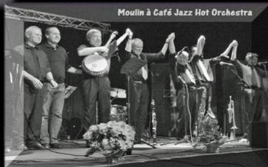
Moulin à Café Jazz Hot Orchestra